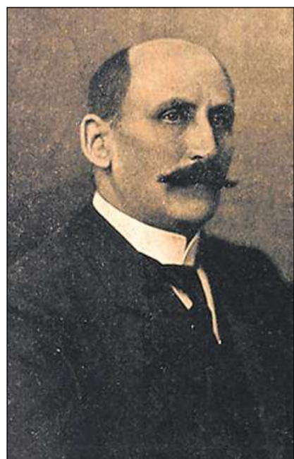
Felix Calonder (1863-1952), confondatur da la Partida liberala e fin oz il sulet cusseglier federal da lingua rumantscha.